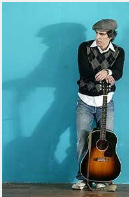
Mikel Erentxun, en la sesión de fotos realizada ayer