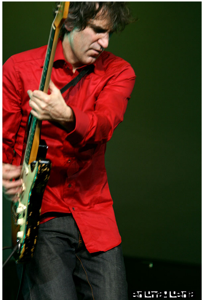
Mikel Erentxun "se despide" en vivo.

Creo que en carreras tan largas si no vas cerrando etapas puedes acabar convirtiéndote en una parodia o una caricatura, porque al final, inevitablemente, sólo vives de tu pasado. Hay que saber cerrar etapas y avanzar si quieres seguir interesando y divirtiéndote. Tienes que ir explorando y mirar siempre hacia adelante. El pasado es muy peligroso, sobre todo si ha sido un éxito.