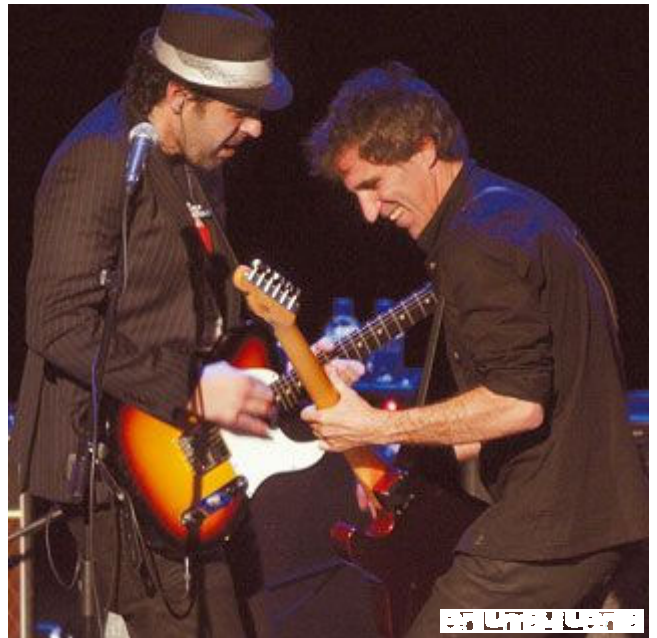
El cantante tuvo guiños constantes con los miembros de su banda.

Desde Placebo, canción con la que dio comienzo la actuación en el Teatro Principal, pasando por En qué mujer, Observatorio (con la que sonaron las primeras palmas), Naif, Seda, California, ¿Quién se acuerda de ti? (que interpretó al piano) o De espaldas a mí, Mikel Erentxun fue repasando toda su discografía.