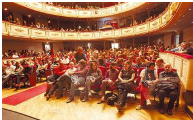
En el aforo del Teatro Principal se juntó público de varias generaciones.

Mikel Erentxun venía a lo que venía y, si con el número de temas interpretados fue generoso, no ocurrió lo mismo con su conversación. Le costó comunicarse verbalmente con el público. Apenas un par de 'sois geniales' y 'muchas gracias Burgos' fueron las únicas frases que salieron de su boca -y un 'muchas gracias Salamanca', que se le escapó pensando que estaba aún en la ciudad charra. Entre el público hubo quien, con mucha gracia, le respondió 'de nada Gabinete'.