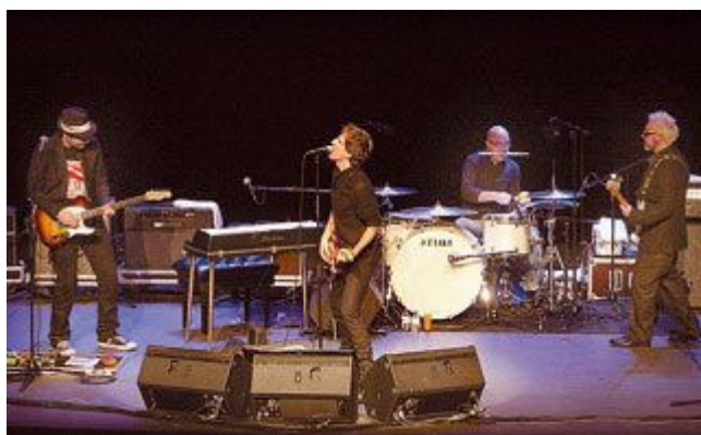
Mikel Erentxun encandiló al Principal.

Mientras iba intercambiando las guitarras y lanzando pequeños guiños a los miembros de su banda, el público recibió con más entusiasmo temas como Esta luz nunca se apagará, A un minuto de ti o Mañana, probablemente uno de los más tarareados de la noche.