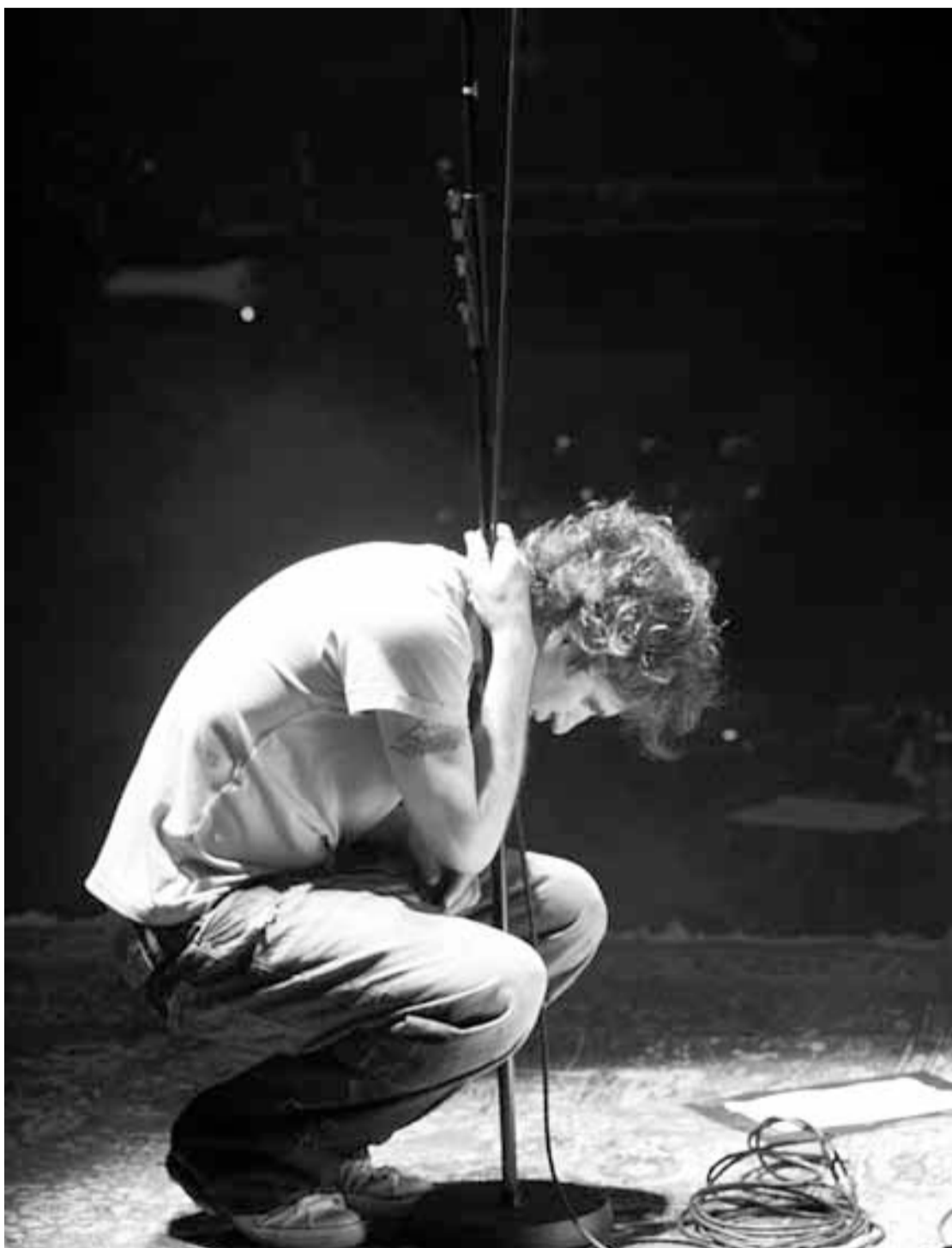
Mikel Erentxun actuará el 7 de marzo en el 'Siete Colinas'.

-Es difícil generalizar todo lo que sale de San Sebastián. Es cierto que quizá lo más conocido