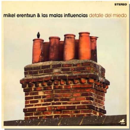
Portada del disco

25 años después, vuelvo a empezar. Después de 10 discos con Duncan Dhu, y 8 en solitario, DETALLE DEL MIEDO inicia una tercera etapa musical: Mikel Erentxun & Las Malas Influencias.