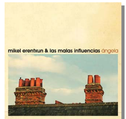
"Ángela", primer single