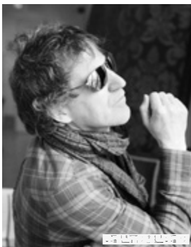
Mikel Erentxun.